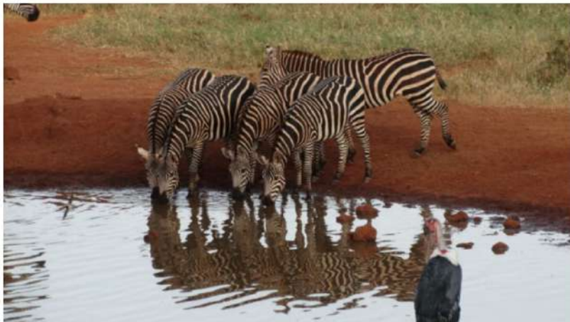
O turmă de zebre a venit să se adape la lacul pe marginea căruia se află lodge-ul nostru, în Parcul Național Tsavo West, Kenya

🕒 aprilie 20, 2021 👤 Elena Draghici 📁 NG Traveler, NG Traveler 🗨️ 0