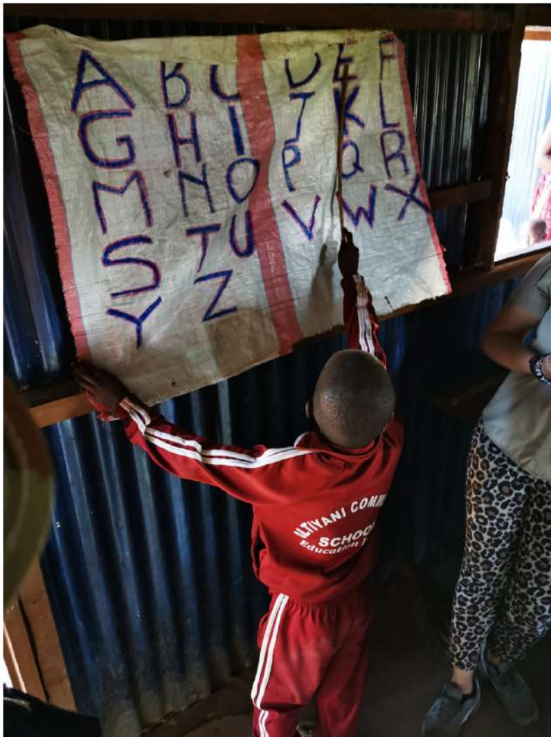
La școala din satul maasailor, un elev citește cu voce tare alfabetul de pe „tabla” improvizată. Parcul Național Amboseli, Kenya