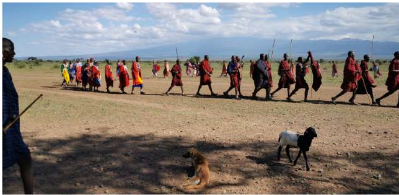
Spectacol pe câmp, în fața satului de maasailor, Parcul Național Amboseli, Kenya