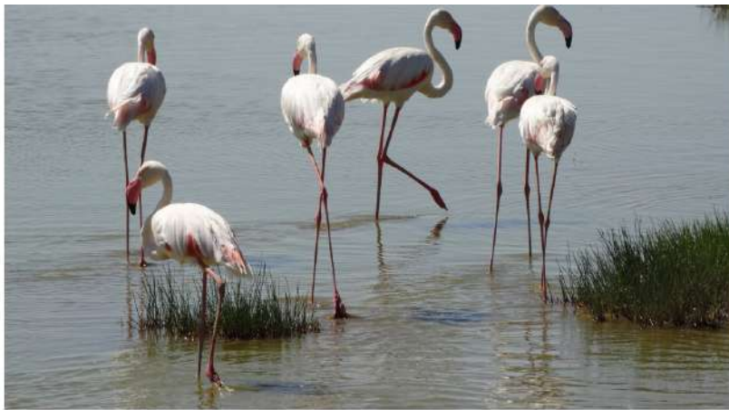
Flamingi în Parcul Național Amboseli