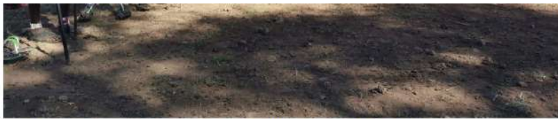
Dansul tradițional maasai este și o competiție: cine sare mai sus. Parcul Național Amboseli, Kenya