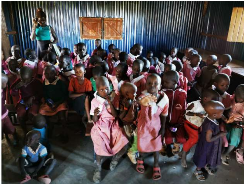
Copiii din școala maasailor