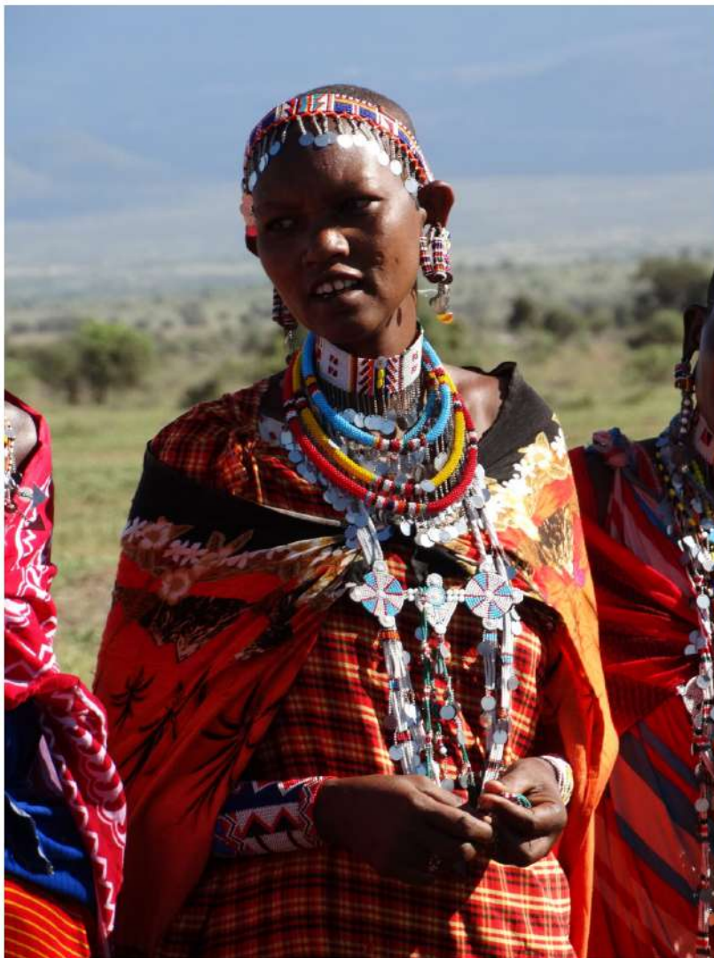
Femeie maasai în port tradițional, Parcul Național Amboseli, Kenya