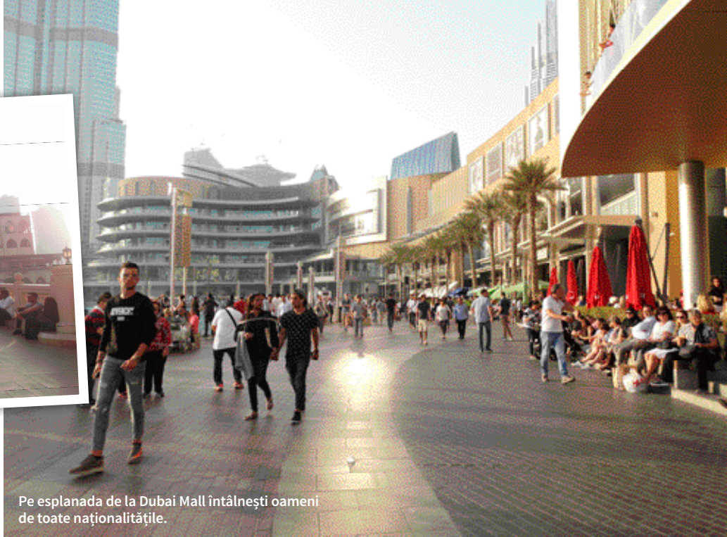
Pe esplanada de la Dubai Mall întâlnești oameni de toate naționalitățile.