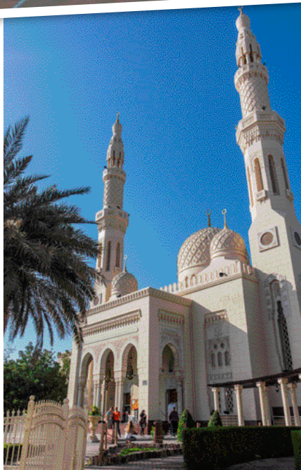
Jumeirah Mosque este una dintre cele mai fotografiate moschei din lume datorită frumuseții sale răpitoare.

care are și un parc acvatic, Aquaventure, dar și o expoziție de delfini. Acesta se află pe Palm Jumeirah – insula artificială care are forma unei frunze de palmier. Dacă vrei să o vezi în toată splendoarea, rezervă un zbor cu elicopterul!