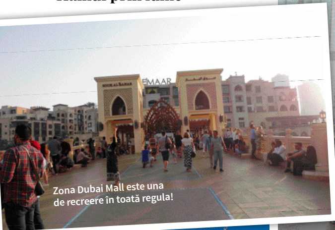
Zona Dubai Mall este una de recreere în toată regula!