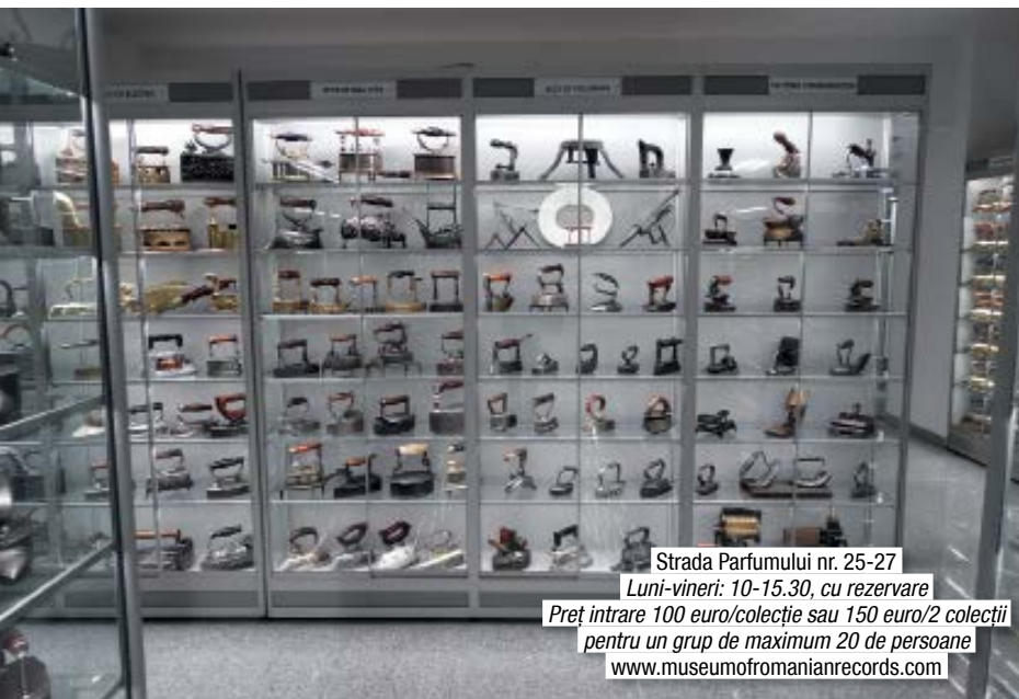
Strada Parfumului nr. 25-27 Luni-vineri: 10-15.30, cu rezervare Preț intrare 100 euro/colecție sau 150 euro/2 colecții pentru un grup de maximum 20 de persoane www.museumofromanianrecords.com

Muzeul închinat celui mai mare muzician român, George Enescu, dezvăluie aspecte inedite, mai puțin știute despre viața celui care a fost atras de muzică încă de la vârsta de trei ani. Printre diplome, premii, manuscrise și fotografii vechi, vei avea ocazia să vezi prima vioară a marelui compozitor, pianul și setul său pentru fumat, din care se remarcă tabachera de argint de forma continentului sud-american. Într-o sală a palatului în stilul baroc francez absolut impresionant prin picturile și decorațiunile arhitecturale, vei păși... chiar în casa natală din Dorohoi a lui Enescu. Cu ajutorul tehnologiei VR, vei vizita practic fiecare încăpere. Periodic, în sala mare a castelului au loc concerte cu intrare gratuită.