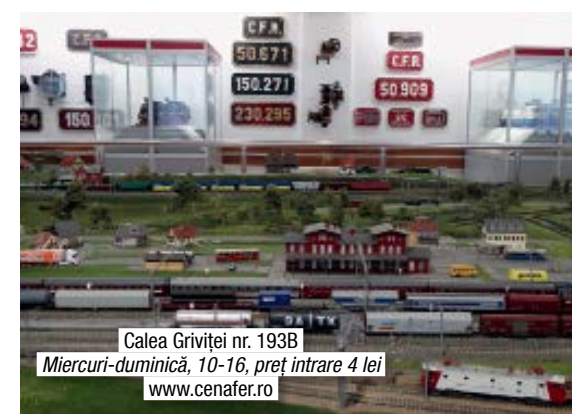
Calea Griviței nr. 193B Miercuri-duminică, 10-16, preț intrare 4 lei www.cenafer.ro

Raiul copiilor și bucuria adulților se regăsesc în fața celei mai mari diorame din România, pe care trenurile funcționează exact ca în realitate! După ce îți vei lua ochii cu greu de la trenurile de toate felurile care opresc în gări, vei observa machetele trenurilor de demult. Poate cea mai impresionantă este macheta celei mai vechi locomotive cu aburi din România. Produsă în Anglia în 1869, locomotiva a circulat pe ruta București-Giurgiu și se află acum în patrimoniul muzeului.