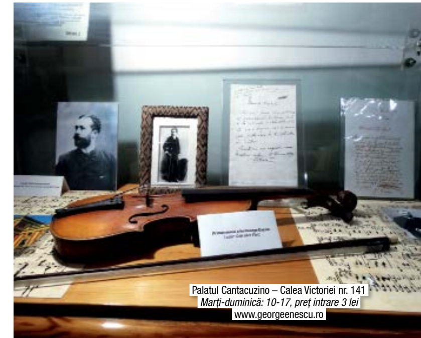
Palatul Cantacuzino – Calea Victoriei nr. 141 Marți-duminică: 10-17, preț intrare 3 lei www.georgeenescu.ro