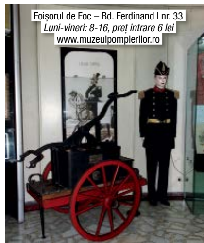
Foișorul de Foc – Bd. Ferdinand I nr. 33 Luni-vineri: 8-16, preț intrare 6 lei www.muzeulpompierilor.ro

Nu mulți știu că în Foișorul de Foc, fostul post de observație al Capitalei, există șase etaje de expoziție dedicate pompierilor. Meseria te duce în perioada romană, de când există dovezi că oamenii s-au luptat cu incendiile. Vei contempla apoi organizarea meseriei de-a lungul timpului, cu uniforme, pompe manuale și alte obiecte de tezaur. În final, vei afla cum sunt pregătiți astăzi pompierii să intervină, grație costumelor aluminizate, machetelor de mașini de intervenție și aparatelor moderne. Ai auzit de marele incendiu din 23 martie 1847, când peste 2.000 de case au ars? Aici, la muzeu, există „arma crimei” – pistolul cu care a fost declanșat, involuntar, incendiul.