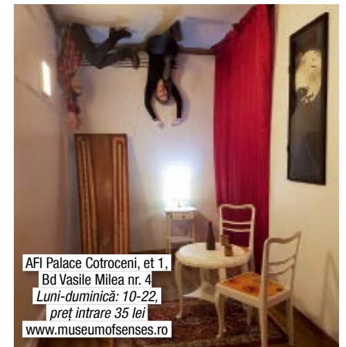
AFI Palace Cotroceni, et 1, Bd Vasile Milea nr. 4 Luni-duminică: 10-22, preț intrare 35 lei www.museumofsenses.ro