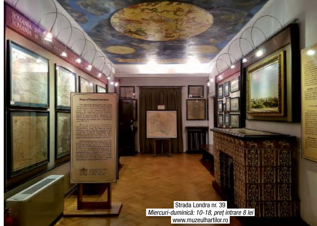
Strada Londra nr. 39 Miercuri-duminică: 10-18, preț intrare 8 lei www.muzeulhartilor.ro

Ești pasionată de hărți vechi? Vei găsi atâtea curiozități doar uitându-te pe hărțile vechi ale regiunilor României: Botushanii, Temeswar sau Gallaz sunt orașe din țară, așa cum se scriau ele pe la 1700! Colecția aparține statului și a fost constituită din donații. Cuprinde peste 900 de hărți din perioada secolelor XVI-XX și reprezintă cartografiile de regiuni, continente, orașe și chiar astronomice. Cea mai veche hartă datează de la 1525. Nu uita să privești vitraliile tavelor din sălile frumoasele clădiri de patrimoniu, vei descoperi și mai multe hărți, pictate de artiști!