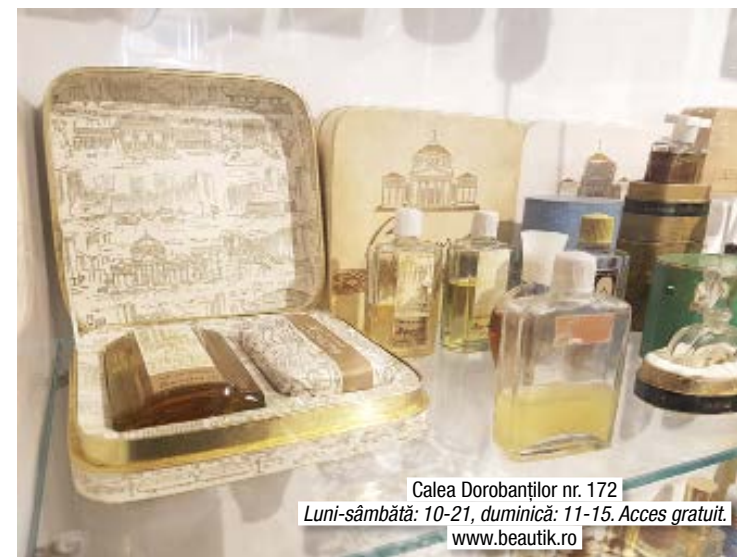
Calea Dorobanților nr. 172 Luni-sâmbătă: 10-21, duminică: 11-15. Acces gratuit. www.beautik.ro

Din peste 15.000 de obiecte de parfumerie colecționate de Iacob Val, proprietarul Beautik, o parte sunt expuse în micul muzeu amenajat în magazin. Parfumi autentice românești vechi, ediții franțuzești de colecție, pudre de obraz dintre cele mai fine, recipiente de cristal, dar și parfumurile preferate ale Regelui Carol I și Reginei Maria te așteaptă să le descoperi pe rând. Chiar dacă nu se pot mirosi, fiind protejate de o vitrină, toată această colecție dezvăluie o istorie a frumosului și a eleganței. Printre exponatele originale de relevanță mondială se numără Vainqueur și Joséphine , create de François Rancé, parfumiерul preferat al Casei Imperiale, pentru Napoleon Bonaparte și soția sa iubită, Joséphine.