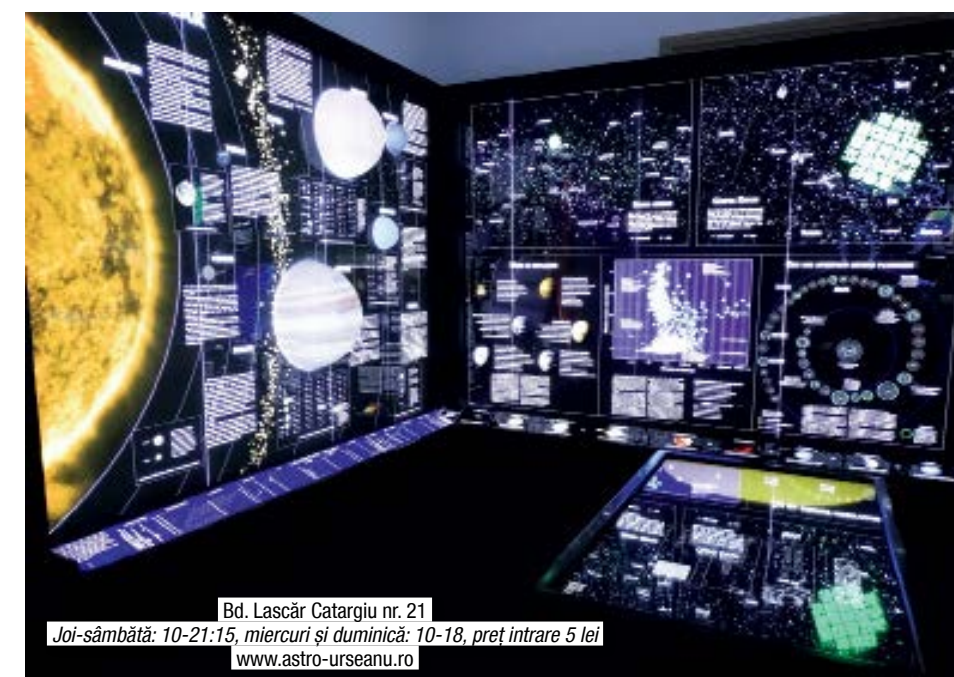
Bd. Lascăr Catargiu nr. 21 Joi-sâmbătă: 10-21:15, miercuri și duminică: 10-18, preț intrare 5 lei www.astro-urseanu.ro

Puține lucruri sunt la fel de fascinante ca Universul. Și, pentru că nu există modalitate mai bună să faci cunoștință cu el, noua expoziție de la Observatorul Astronomic „Amiral Vasile Urseanu” te va plimba printre stele, galaxii mai apropiate sau mai îndepărtate, până pe Lună și-napoi și printre planete. Citind descrierile presărate cu umor, vei afla, de pildă, că „nu putem trăi fără înghețată”, referitor la condițiile de pe planeta Mercur! Expoziția este un deliciu chiar și pentru adulți. Iar după ce cunoști spațiul, un ecran interactiv te așteaptă să vezi Universul prin diverse spectre de lumină, ce nu se pot observa cu ochiul liber. Seara, în funcție de spectacolele cerești, se fac observații de pe terasa sau din cupola clădirii, prin telescoape performante.