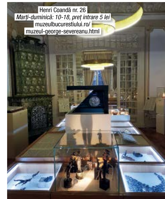
Henri Coandă nr. 26 Marți-duminică: 10-18, preț intrare 5 lei muzeulbucurestiului.ro/ muzeul-george-severeanu.html