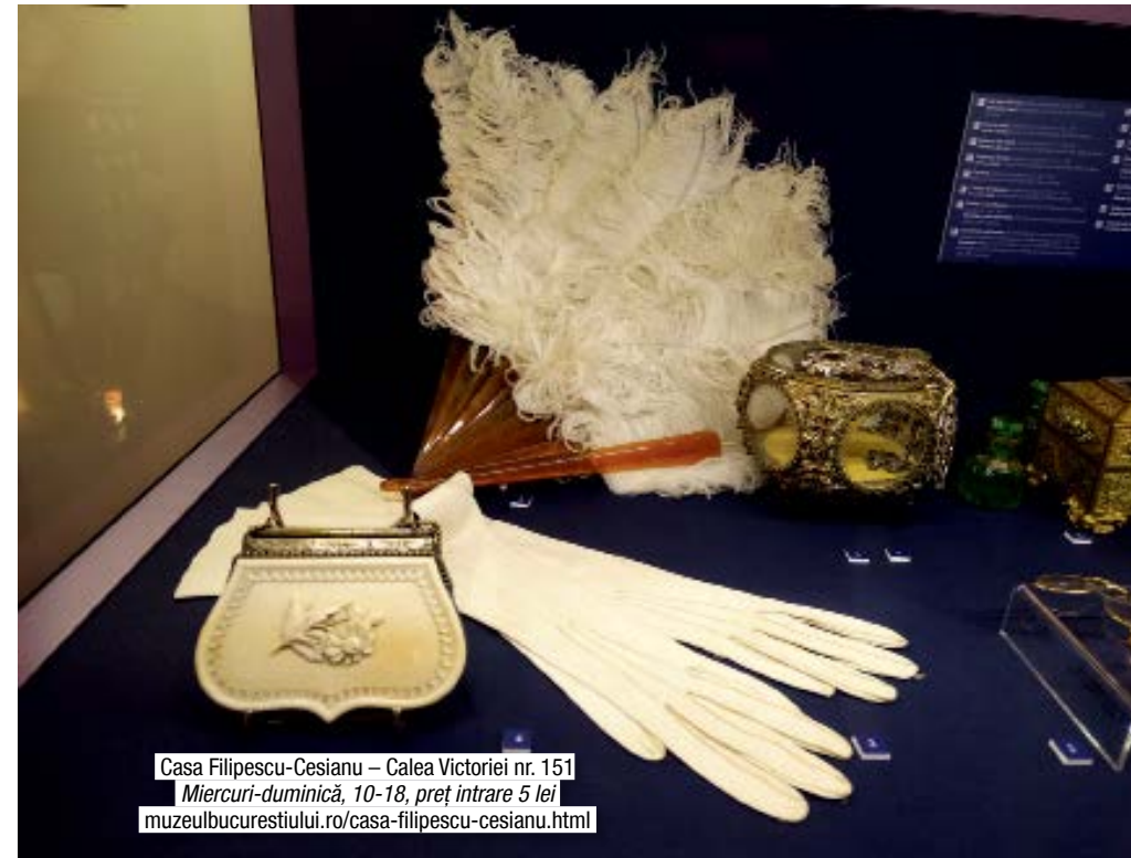
Casa Filipescu-Cesianu – Calea Victoriei nr. 151 Miercuri-duminică, 10-18, preț intrare 5 lei muzeulbucurestiului.ro/casa-filipescu-cesianu.html