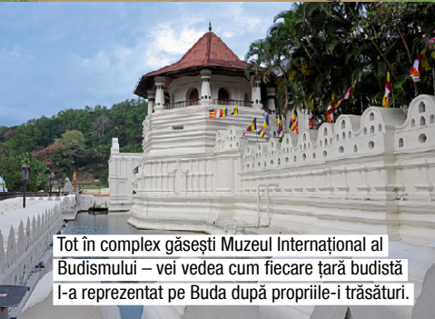
Tot în complex găsești Muzeul Internațional al Budismului – vei vedea cum fiecare țară budistă l-a reprezentat pe Buda după propriile-i trăsături.