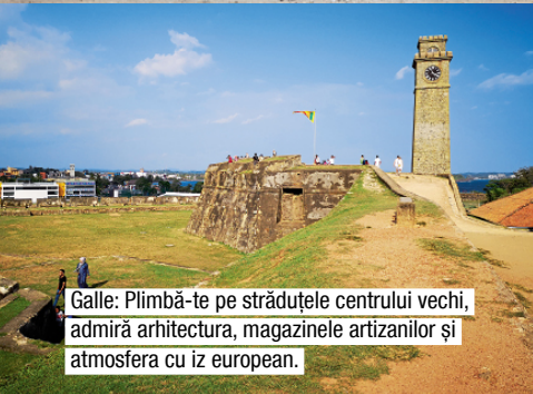
Galle: Plimbă-te pe străduțele centrului vechi, admiră arhitectura, magazinele artizanilor și atmosfera cu iz european.