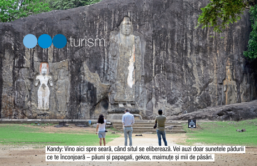
Kandy: Vino aici spre seară, când situl se eliberează. Vei auzi doar sunetele pădurii ce te înconjoară – păuni și papagai, gekos, maimuțe și mii de păsări.