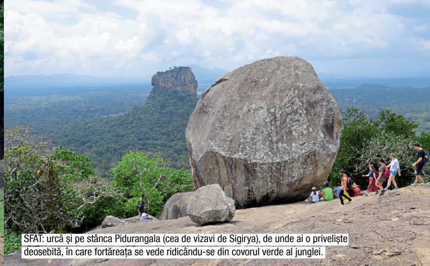
SFAT: urcă și pe stâncă Pidurangala (cea de vizavi de Sigiriya), de unde ai o priveliște deosebită, în care fortăreața se vede ridicându-se din covorul verde al junglei.