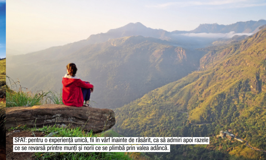
SFAT: pentru o experiență unică, fii în vârf înainte de răsărit, ca să admiri apoi razele ce se revarsă printre munți și norii ce se plimbă prin valea adâncă.