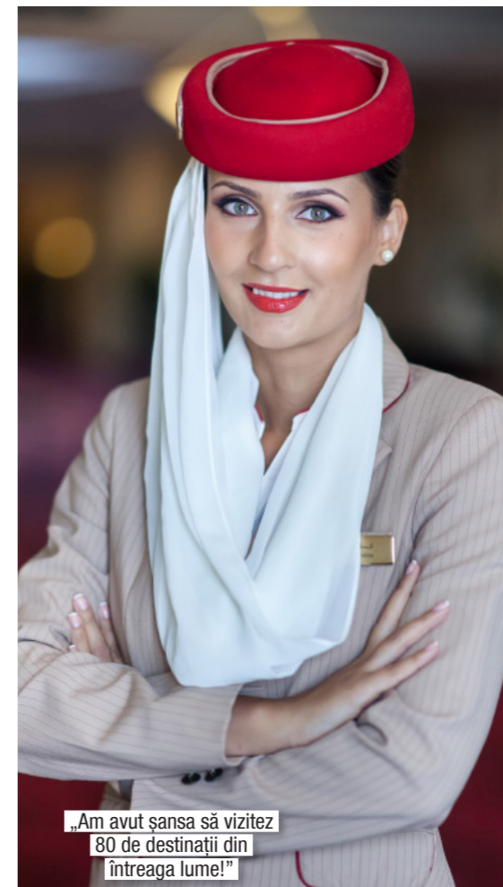
„Am avut șansa să vizitez 80 de destinații din întreaga lume!”